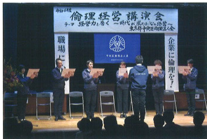
※中央区倫理法人会主催倫理経営講演会での朝礼実演

その中で関係性が築かれていき、『何のために働くか』という働く意義なども教える機会ができていきます。「仕事とは、ただお金をもらって生活をするためだけじゃないんだよ」と。こうしたことも、朝礼を通じて『働くとはどういうことか』『チームはどうあるべきなのか』といった価値観を浸透させ、チームに一体感が生まれます。そう考えると朝礼の力は本当に大きいと思いますね。